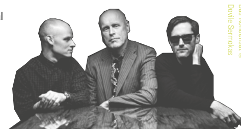
Das Kondensat

So 31. 16:00 Saal, Green Room Houbara - Resonanzen Iran 2026 | Tag #2 VVK € 22 / 12 erm. | AK € 25 / 15 erm.