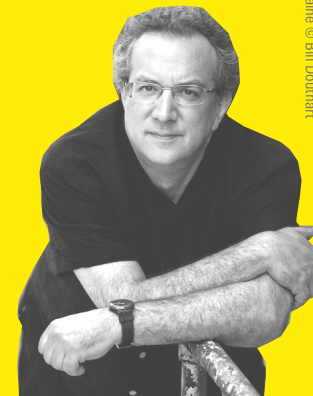
Uri Caine

24. April 20:00, Saal URI CAINE TRIO Jazz, Improvisation