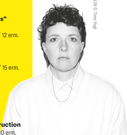
LIN @ Tina Vogt

So 26. 20:00 JAKI Thomas Azier VVK € 26 | AK € 30