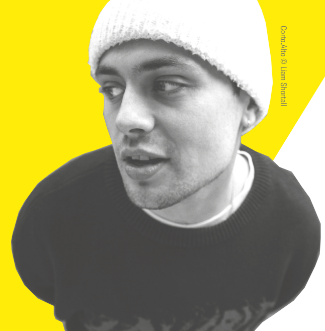
Corto.alto