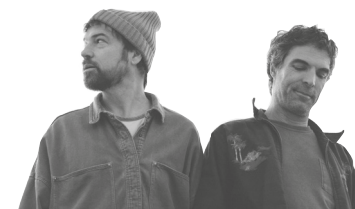
The Barr Brothers @ Lauen Kallen