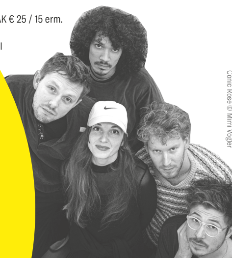
Conic Rose

Do 30. 21:00 Saal & JAKI Maitanzgelegenheit VVK € 15 | AK € 20