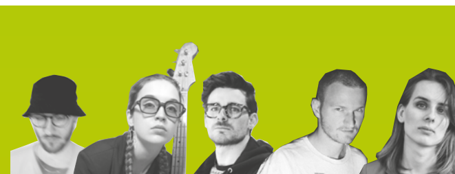
Stadtgarten Experimental Band @Artists

Vorverkauf: Tickets sind unter www.stadtgarten.de und www.ticket.io/ stadtgarten erhältlich (zzgl. Gebühren) Newsletter: Wenn Sie immer aktuell informiert werden möchten, abonnieren Sie unseren wöchentlichen Newsletter unter www.stadtgarten.de