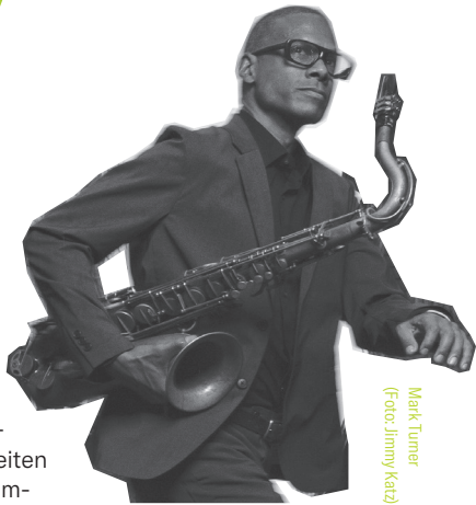
Mark Turner