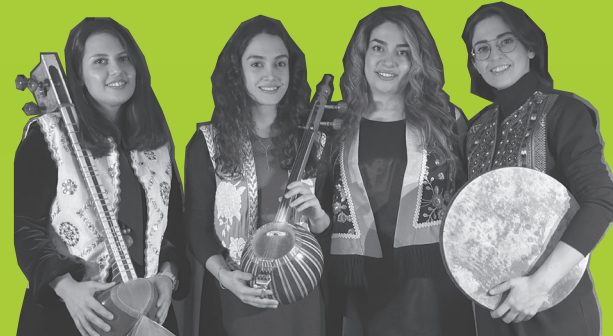
Aban Ensemble

Do 25. 19:00 Saal Houbara – Resonanzen Iran: Podiumdiskussion Eintritt frei