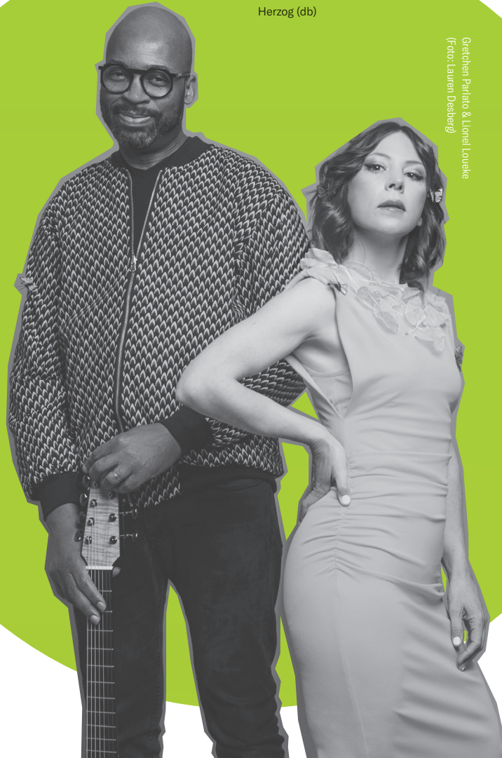
Gretchen Parlato & Lionel Loueke